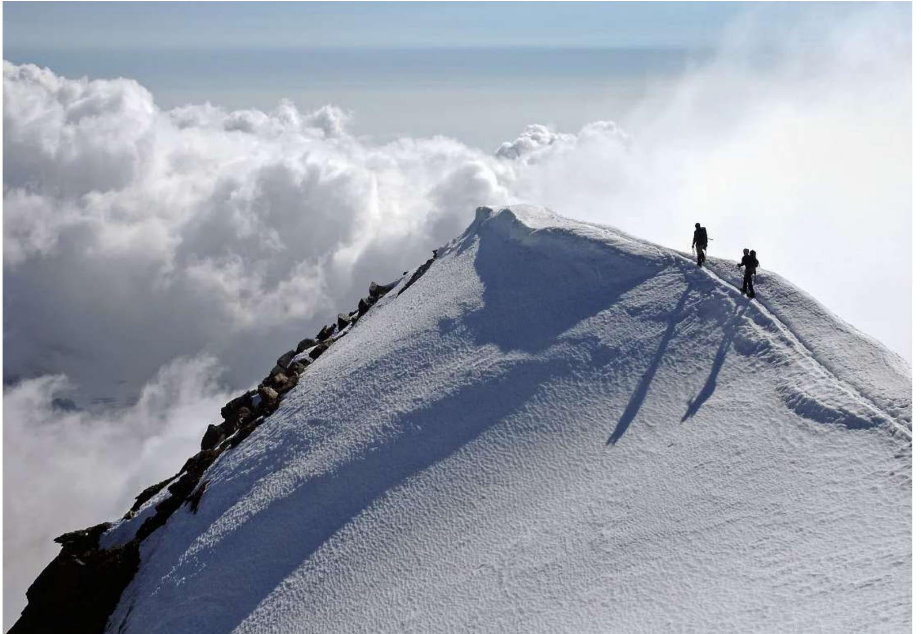
Fasziniert immer mehr Leute: Outdoorsport, hier Bergsteigen am Weissmies ob Saas-Grund.

General Motors hat beim US-Verkehrsministerium eine Zulassung beantragt, um 2019 fahrerlose Autos ohne Lenkrad und Gaspedal auf die Strasse zu bringen. Der US-Autokonzern will beim Zukunftsgeschäft mit Roboter-Taxis vorne mit dabei sein. Man habe bereits das erste produktionsfertige Fahrzeug am Start, das gefahrlos ohne jede manuelle Kontrolle funktioniere. (SDA)